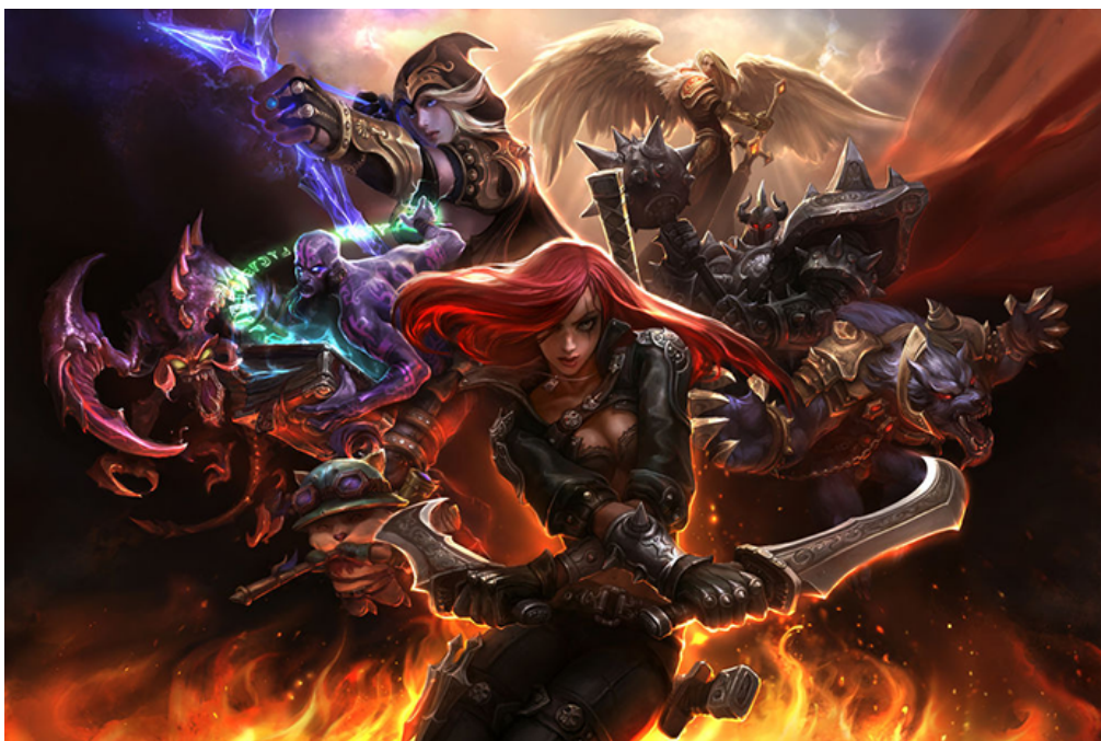
Figura 09 - Em League of Legends, o jogador pode jogar com homens, mulheres, lobisomens, árvores... personagens de todos os gêneros (e espécies)!