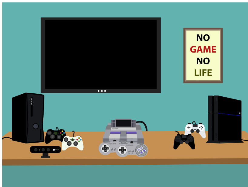
Figura 06 - Com maior independência, os jovens adultos conseguem satisfazer os desejos que quando menores não podiam, como ter todos os videogames desejados!