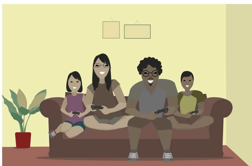
Figura 04 - Crianças adoram jogar com os pais, além de passar tempo em família se divertindo, eles ainda deixam os pequenos ganharem!