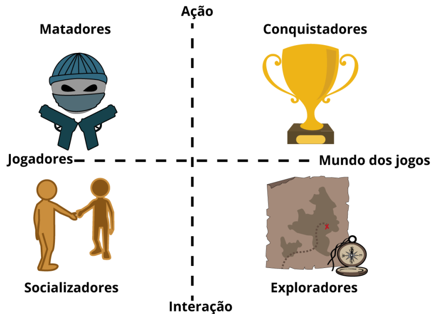
Figura 10 - Apresentação visual da taxonomia de Bartle. O eixo vertical mostra a classificação com relação ao tipo de ação (ação vs interação) que o jogador executa, enquanto o eixo horizontal mostra a preferência de alvo de atuação (jogadores vs mundo do jogo).

Uma curiosidade é o recurso mnemônico que o autor criou para ajudar na memorização dos grupos, associando cada grupo a um naipe do baralho: Ouro para Conquistadores, Espada para Exploradores, Paus para Matadores e Copas para Socializadores. Bom, em inglês a associação faz mais sentido, mas pense assim: ouro como uma recompensa para as conquistas, espadas para explorar territórios novos, paus para bater na cabeça dos outros e corações para fazer amizades. Forcei a barra, hein?