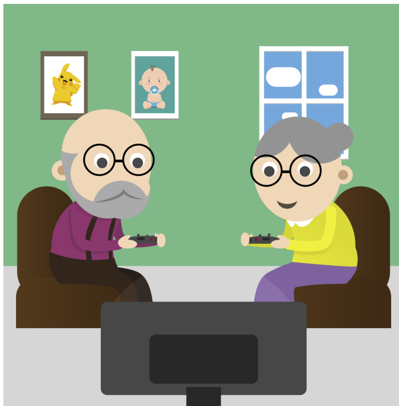
Figura 08 - Confie nesses caras, eles sabem o que estão fazendo!

Quando falamos acerca do mercado de jogos nas aulas passadas, mostramos uma estatística que evidenciava o “envelhecimento” dos jogadores, com muitos representantes nos grupos dos adultos. Isso se deve ao fato de que o hábito de jogar foi estabelecido durante a juventude e passou a ser uma atividade de lazer natural das pessoas, o que não era tão comum no início da indústria. Convenhamos, uma indústria que começou em 1970 é muito nova! Ainda estamos no início dela!