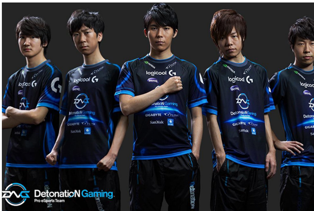
Figura 02 - Times profissionais de esportes eletrônicos ganham cada vez mais destaque.