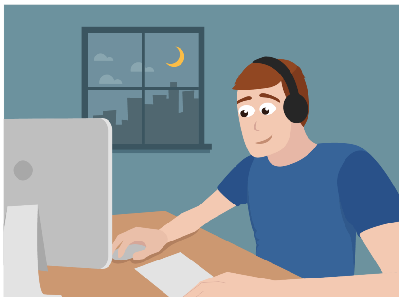
Figura 05 - Os jovens começam a dedicar mais tempo aos jogos nessa idade. E os pais não estão mais na foto!