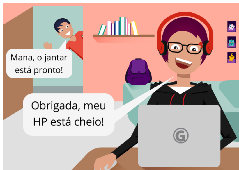
Figura 07 - Com menos tempo para jogar devido às responsabilidades do dia a dia, os adultos precisam se virar com suas pequenas folgas para jogar, o que faz com que ele seja bem seletivo na sua escolha de jogos.