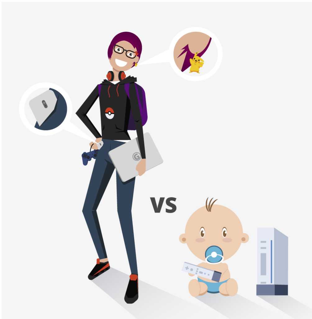
Figura 01 - Os dois principais tipos de jogadores, e seus habitats naturais.

Podemos destacar também aqueles jogadores que são atletas de e-sports : eles são jogadores com o perfil hardcore , porém costumam se dedicar a um jogo no qual estão inseridos em contextos competitivos, seja individualmente ou em equipe. Como a competição exige que eles invistam longas horas de treino, não é comum que eles joguem vários jogos simultaneamente, o que os coloca em um mercado nicho. Entretanto, eles costumam ter máquinas e periféricos de alta qualidade, para garantir a performance em campeonatos, o que os tornam consumidores importantes para essas indústrias.